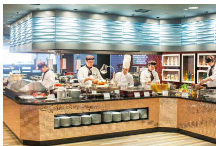
ブッフェダイニング ケッヘル

新横浜プリンスホテル イベント予約係 TEL:045-471-1111(10:00A.M.～6:00P.M.)