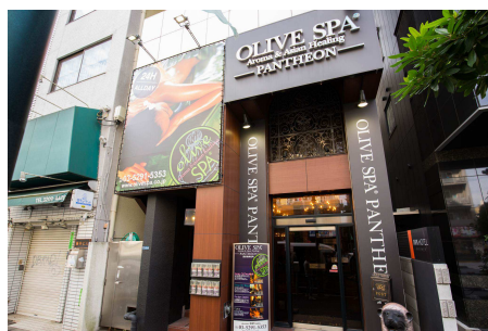
OLIVE SPA PANTHEON 新宿歌舞伎町店